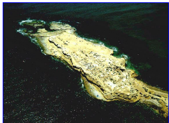
Illeta dels Banyets (El Campello, Alacant)

La Historia de la Interacción Social, es decir, la dinámica temporal, los cambios y transformaciones que experimenta a través del tiempo, no pueden observarse en ningún registro arqueológico y/o histórico. Aquello que llamamos Patrimonio, sin embargo, muestra algunas de las consecuencias materiales de esas