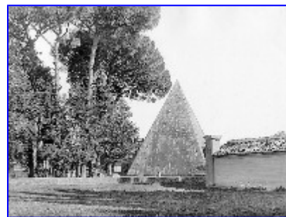
Imagen de archivo de la pirámide de Cestius (Roma)

Y sin embargo, un día el Estado decide construir una presa, que permitirá iniciar cultivos de regadío en una amplia zona y mejorará los suministros de energía eléctrica. Pero una cueva con dibujitos pintados se entromete en el propósito. Gran movilización local, nacional e internacional; insultos al Gobierno, "que quiere destruir nuestras raíces y herencia común". En qué quedamos, ¿la Arqueología no sirve para nada, pero las piedras antiguas no hay que tocarlas porque son muy importantes? Resultado de las protestas: la presa no es construida; sin los regadíos y ante las necesidades de mano de obra barata, la población local emigra a la periferia de las grandes ciudades, y la cueva se muere de aburrimiento por que nadie tiene la peregrina idea de ir a visitarla.