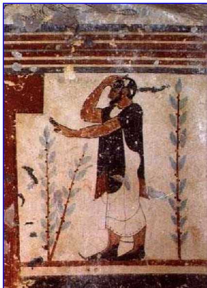
Pintura de tumba etrusca

Simultáneamente al aburrimiento que engendra el Pasado, surge el anuncio del fin de la Historia, potenciando la pasividad y estancamiento social, como efecto de la comodidad por la seguridad que comporta el liberalismo moderno: el libre-mercado es la apariencia natural del orden común, y a sus leyes debemos acogernos con fervor y fe ciega. El fin de la Historia de la Humanidad y la aparición de la Herencia Común de esa misma Humanidad, coincide pues, con la gran solución, un sólo mercado "libre" de punta a punta.