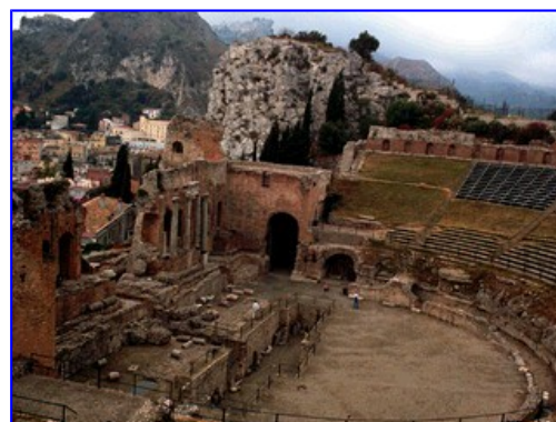
Teatro de Tauro

Hemos de tener bien presente que la Matemática no es una propiedad de la naturaleza. No hay cosas y fenómenos de tipo matemático y otros que no lo sean, sino que siempre que expresemos una idea por medio de relaciones de orden entre sus componentes, estaremos expresándola matemáticamente. La Matemática es, por tanto, un lenguaje artificial usado para representar cosas.