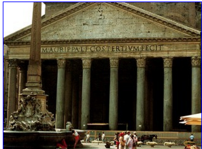
Mausoleo de Agripa

El objetivo de todo análisis histórico debiera consistir en estudiar los cambios en las relaciones sociales a lo largo de un proceso determinado de tiempo hasta el presente . En otras palabras, de lo que se trata es de empezar con un estudio exhaustivo (estadístico) de nuestra sociedad, midiendo las formas de interacción social en ella, por ejemplo. A continuación habría que centrarse en el descubrimiento de algún elemento o contradicción en esas formas actuales de interacción, intentando determinar el proceso de formación de la misma, esto es, la secuencia de cambios que, a lo largo del tiempo ha determinado que esa contradicción aparezca en las circunstancias actuales. Si "medimos" la conducta social, es pues para estudiar la relevancia causal de las distintas medidas y como resultado, la causa de esa conducta y sus consecuencias.