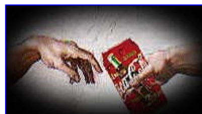
Imagen de una lata de Coca-cola

El Patrimonio Cultural de la Humanidad está formado, casi exclusivamente, por edificios hermosos, elegantes, llenos de poesía y belleza, que exaltan los valores de simetría, regularidad y "perennidad". Los visitantes (exclusivamente del Primer Mundo) se extasían ante tanta belleza y dicen: "¿no te gustaría haber vivido en este Palacio, Castillo, Ciudad,...?" Nostalgia por el Pasado, nostalgia de un orden social en el que unos poquísimos disfrutaban en exclusiva las cosas bellas que hacían la mayoría. Sólo un orden social como ese permite la belleza, ... no como en una sociedad de sindicatos y huelguistas, con baja productividad laboral y productos industriales de pésima calidad.