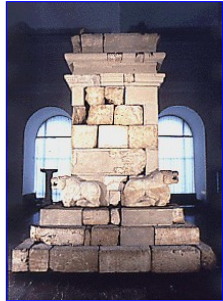
Sepulcro turritiforme de Pozo Moro