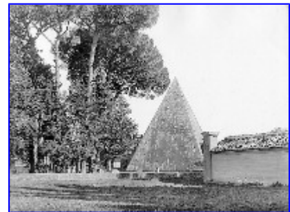
Imagen de archivo de la pirámide de Cestius (Roma)

Y sin embargo, un día el Estado decide construir una presa, que permitirá iniciar cultivos de regadío en una amplia zona y mejorará los suministros de energía eléctrica. Pero una cueva con dibujitos pintados se entromete en el propósito. Gran movilización local, nacional e internacional; insultos al Gobierno, "que quiere destruir nuestras raíces y herencia común". En qué quedamos, ¿la Arqueología no sirve para nada, pero las piedras antiguas no hay que tocarlas porque son muy importantes? Resultado de las protestas: la presa no es construida; sin los regadíos y ante las necesidades de mano de obra barata, la población local emigra a la periferia de las grandes ciudades, y la cueva se muere de aburrimiento por que nadie tiene la peregrina idea de ir a visitarla.