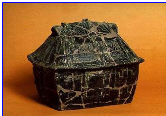
Urna cineraria lacial

El Pasado ya no es un conjunto de gente y de relaciones, vinculaciones entre personas, sino cosas inertes. Si no son bonitas, a nadie le interesa. Juzgamos el Pasado en la medida en que se produjeron en él obras que hoy consideramos "bonitas". En ocasiones, la extrema antigüedad de unos cacharros puede influir respeto a lo que no nos parece "bonito", pero ahí se acaba todo. El Pasado es algo para usar y conservar. "Usar" significa aquí ver, testificar. "¡Ah, sí, había una época en que hacían esas cosas!". "Conservar" significa dejar algo bien guardadito sin que nadie lo toque.