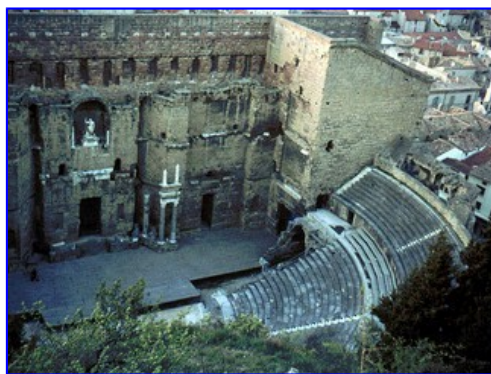
Teatro de Arausio (Orange)

Claro que arqueólogos y arqueólogas deben estudiar los datos conservados del pasado y llegar a saber el máximo acerca de ellos. Pero su estudio no acaba al documentar e interpretar ese registro arqueológico (Patrimonio), sino que acaba de empezar. Estudiar cacharros rotos y piedras viejas sólo tiene sentido si lo que realmente hacemos es buscar evidencias que nos permitan averiguar cómo y por qué los fenómenos sociales actuales adoptan la forma que adoptan.