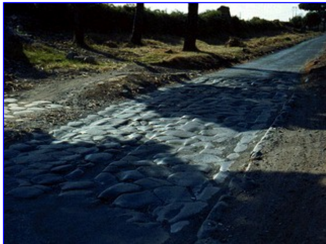
Via Appia (Roma)

unidades analíticas. En otras palabras, lo que nos interesa es una investigación de las causas de las particulares formas de interacción que hemos "medido" en el registro arqueológico (Patrimonio), así como los efectos que dichas formas de interacción produjeron en la vida social de aquellas y nuestras comunidades.