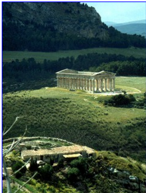
Templo de Segesta

especialistas (enfoque subjetivista), la cantidad no existe antes que el proceso de medición tenga lugar. No hay cantidades en la naturaleza, sino operaciones de medida artificiales, que proporcionan unos resultados más o menos coherentes. Como en todo, siempre hay terceras vías, así, según los partidarios del enfoque relacional, una cantidad existe si y solo si existe una relación cuantitativa entre dos objetos. Un objeto tendrá, pues, una cantidad de algo si toma parte en una relación cuantitativa.