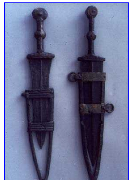
Dagas de la Edad del Hierro (Etruria)

Desde los años 60, ha ido ganando predicamento la necesidad de una arqueología que estudie a la persona que está detrás del artefacto, y no sólo interesada en documentar el artefacto. Ahora bien, en demasiadas ocasiones, ese estudio confunde "medios" con "finalidades", creyendo que el objetivo final de la Arqueología es "documentar" el Pasado, aunque lo que se documente sean relaciones sociales y no sólo cacharros. No