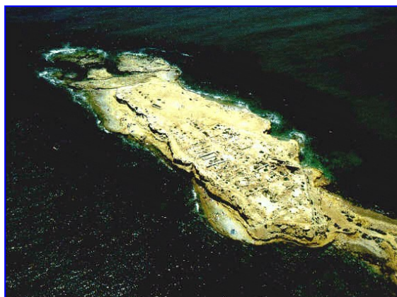
Illeta dels Banyets (El Campello, Alacant)

La Historia de la Interacción Social, es decir, la dinámica temporal, los cambios y transformaciones que experimenta a través del tiempo, no pueden observarse en ningún registro arqueológico y/o histórico. Aquello que llamamos Patrimonio, sin embargo, muestra algunas de las consecuencias materiales de esas