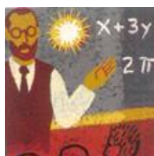
Sovint els professors...

Una qüestió a part és la qualitat, que representa un dels temes essencials de l'ensenyament virtual. L'experiència de la UOC demostra que l'ensenyament virtual pot generar una actitud crítica i reflexiva entre els estudiants, és a dir, que pot donar lloc a un ensenyament de veritable qualitat. L'objecció que els estudiants de les universitats virtuals troben a faltar "les discussions a altes hores de la nit (...) i el paper de l'equip de futbol" (Universitat d'Illinois, 1998-1999) simplifica una realitat que és molt més complexa. L'èxit o el fracàs de l'ensenyament virtual no es pot mesurar amb els mateixos instruments que utilitzem per observar l'ensenyament tradicional. Necessitem instruments diferents, i crec que encara no els hem trobat.