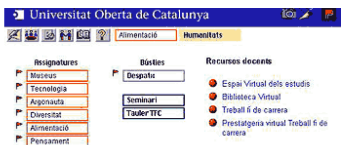
Sala del TFC d'Humanitats: exemple de curs en línia

Com acabo de dir, un dels primers problemes amb què es van haver d'enfrontar els "inventors" de la UOC va ser com finançar les despeses inicials de la universitat virtual. Així, la decisió que van prendre finalment va ser crear un sistema mixt de finançament públic i privat. Durant els primers anys, el Govern de la Generalitat pagaria una quantitat per donar suport institucional als estudiants virtuals de la UOC. El compromís, per això, era que a poc a poc la UOC generaria beneficis econòmics per sufragar una part important de les seves necessitats.