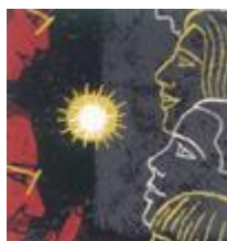
El silenci virtual...

Però hi hauria d'haver més indicadors de l'ensenyament virtual d'alta qualitat. Per exemple, la capacitat de desenvolupar una actitud crítica no és solament una possibilitat, sinó que, de fet, el sistema virtual pot ser un catalitzador excel·lent d'aquesta capacitat. Quan s'utilitza l'hipertext, s'obre la possibilitat d'explorar la capacitat de l'estudiant per a la interrelació conceptual, la comparació, la interconnexió i, doncs, el coneixement multidisciplinari. A més a més, els fòrums interactius i el correu electrònic personal propicien un alt nivell d'interacció entre l'estudiant i el professor, com ja s'havia observat en l'estudi de les actituds dels estudiants respecte a la formació universitària en línia (Westbrook, 1999).